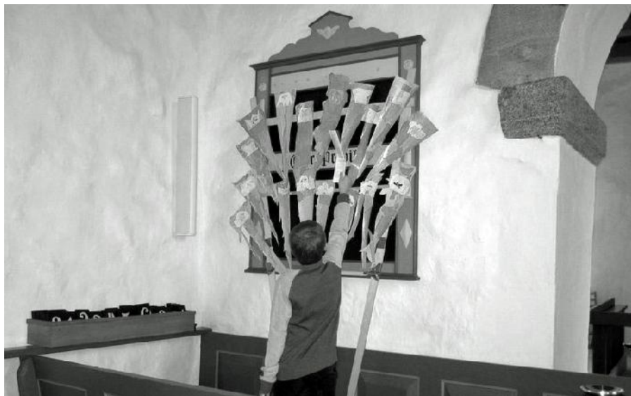
Børnene illustrerede Helligånden i form af ildtunger og tekst