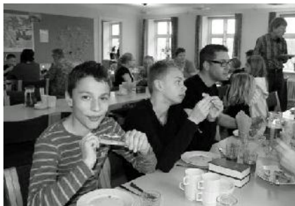
Pizza i Præstegården

Vi har afsluttet forløbet med gudstjeneste i Tulstrup kirke sammen med minikonfirmanderne fra Dover sogn.