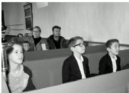
Gudstjeneste i Tulstrup kirke