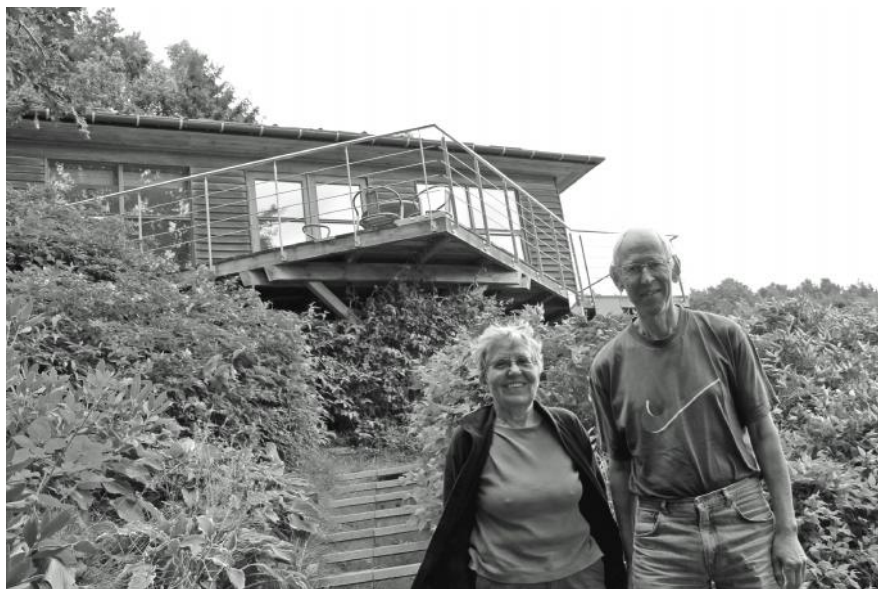
Sommerpalads på skrænten