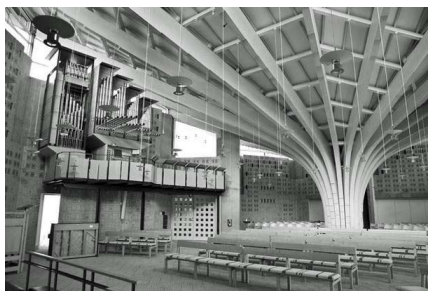
Kirkerummet i Lyng kirke

Se billeder fra turen på: www.tulstrupkirke.dk/galleri